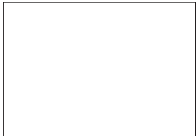
Proposta di modifica